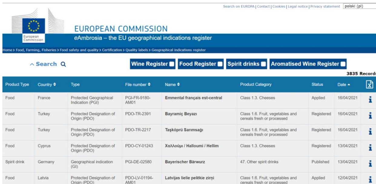
Рис.2 Реєстр eAmbrosia

База eAmbrosia оснащена пошуковим апаратом, який дозволяє здійснювати пошук за категорією продукту, за його назвою та за країною.