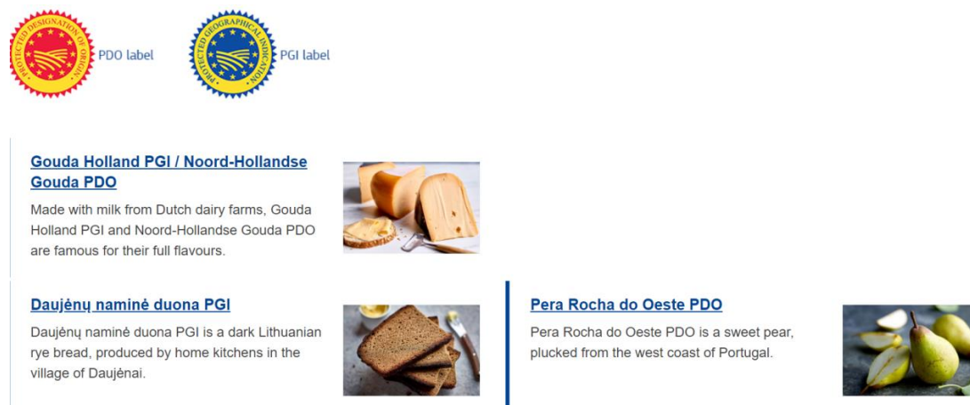
Рис.1. Інформація про товари високої якості з ЄС.

Також наявний реєстр eAmbrosia[4], де реєструють 4 види товарів (рис.2), а саме вина; харчові продукти; напої з вмістом спирту; ароматизовані вина.