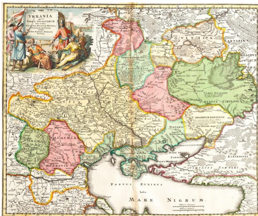
Рис.1. Iohann Baptisto Homanno (Homann). Ukrania quae et Terra Cossacorum .

Наведемо приклади картографічної продукції, що є творчою. На рис.1 представлена карта України німецького гравера, картографа, засновника картографічного видавництва в Нюрнберзі Іоганна Баптиста Гоманна(1716 р.). Це карта з колекції А. Грегоровича, зберігається в Нюрнберзі, її формат 46 x 57,5 см. Деякі подробиці: масштаб наведено в німецьких і польських милях; назви географічних об'єктів – латинською мовою; техніка виконання— гравюра на міді; акварельне колорювання.